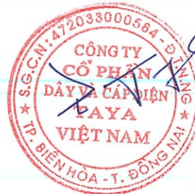
WANG TING SHU