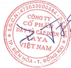
WANG TING SHU