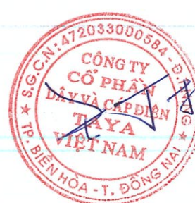
WANG TING SHU